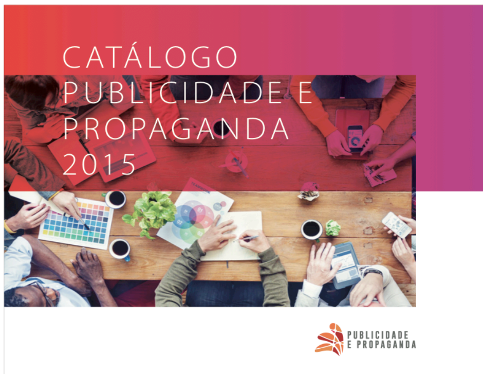
Figura 4 – Capa do Catálogo do Curso de Comunicação Social