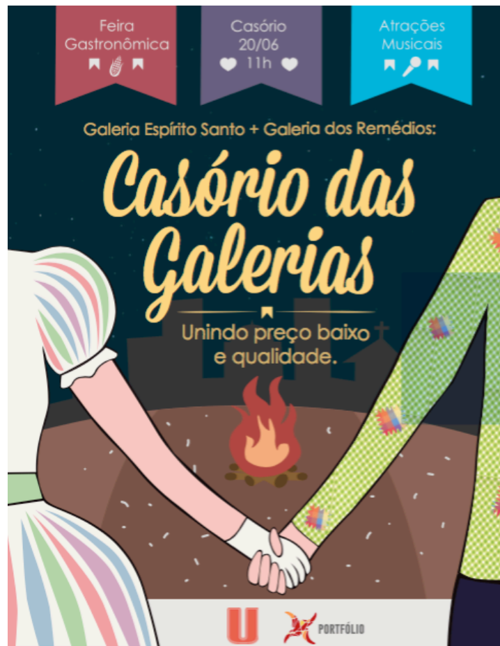
Figura 2 – Cartaz de divulgação das galerias populares