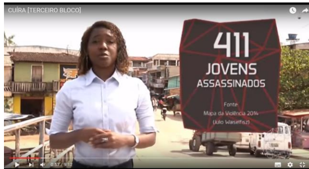
Figura 12 – Reportagem especial – Chacina/Juventude. 2015.

Em Novembro de 2014 a cidade de Belém foi marcada por uma chacina que atingiu os bairros que são destaque no telejornal, além de outros. Com a aproximação da data de um ano do ocorrido, o Cuíra , no seu terceiro bloco, apresentou uma reportagem especial sobre a realidade dos jovens da periferia, pois homens negros e jovens foram a maioria dos assassinados. A reportagem também destacou não só a luta dos familiares que ainda buscam justiça, como também as formas de resistência da juventude local.