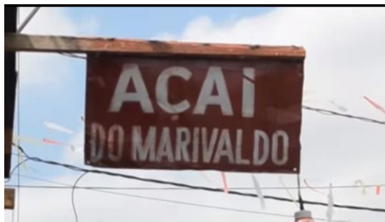
Figura 3 – Publicidade presente nos intervalos, 2015.

O telejornal Cuíra se lança na perspectiva contrária a essa proposta. O produto vem se somar a muitas iniciativas que têm o protagonismo de atores sociais como foco das abordagens. No projeto se prioriza, por exemplo, a publicidade da própria periferia, com seus carros-som, boca de ferro, anúncios de salões de beleza, açougues, tabernas. Entre os destaques está a placa da venda de açaí, uma cena comum da periferia de Belém. O açaí é originário de uma palmeira amazônica e é muito consumido no Estado. A inclusão do empreendedorismo local entre os blocos do telejornal provoca uma transgressão ao padrão de mercado hegemônico, que se verifica nos telejornais diários do país.