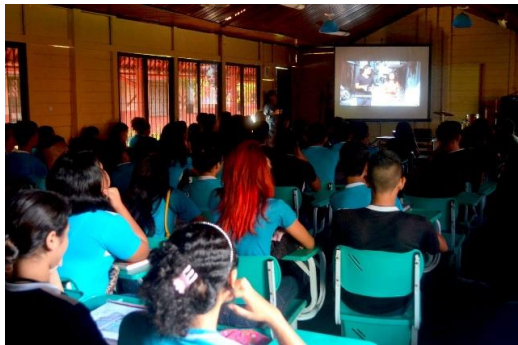
Figura 1 – Exibição do telejornal na Escola E.E.F.M. Mário Barbosa

A exibição do programa ocorreu no dia 9 de dezembro de 2015, na escola E.E.F.M. Mário Barbosa, localizada no bairro da Terra Firme. Afinal, o Cuíra precisava ser apresentado em primeira mão à comunidade, somente depois foi postado no site do Youtube . O evento contou com um show musical de artistas da própria periferia e que fizeram parte do telejornal.