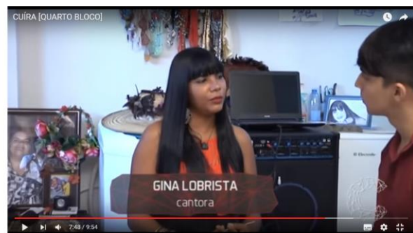
Figura 14 – Reportagem Artistas/Periferia