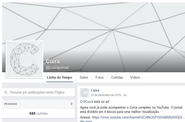
Figura 4 - Página no Facebook

As postagens seguiram o formato: uma foto ou printscreen (ver figura 05) de tela do vídeo do ator social, acompanhado de um trecho em aspas significativo de sua fala. As ações da equipe também foram publicadas, como bastidores das gravações e a sessão de exibição na comunidade. A página alcançou 685 curtidas, continua ativa, mas sem atualizações. No entanto, as interações (curtidas) são quase diárias. O canal no Youtube teve 21 inscrições e mais de 450 visualizações nos vídeos, divididos em 4 blocos.