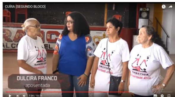
Figura 11 – Reportagem Manifestações Culturais/Resistência.