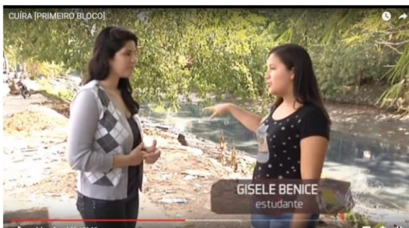
Figura 8 – Reportagem Rio/Poluição 2015.

As reportagens de cultura e lazer, que são fixadas, muitas vezes, no último bloco de telejornais, no Cuíra já aparecem no primeiro. A finalidade é dar visibilidade à pluralidade da cultura das comunidades. O conhecido “Baile da Saudade”, que acontece às segundas-feiras, em uma casa de shows no bairro do Jurunas, destaca o público diversificado dessas festas, que recebem de jovens a adultos.