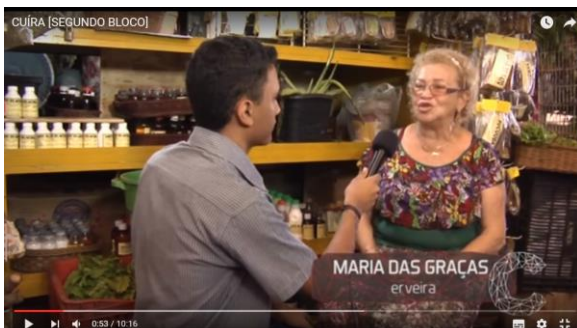
Figura 10 – Reportagem Feira/Afeto.