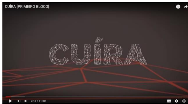
Figura 6 – Assinatura final na vinheta de abertura

mesmas linhas se conectam formando a parte inferior do quadro de abertura e vinheta. A música utilizada chama-se Cumbia do Zumbi , da Banda Pop Instrumental Paraense, Strobo 7 . Foi escolhida por conter marcas das guitarradas amazônicas e do brega, ritmo musical tão presente na periferia