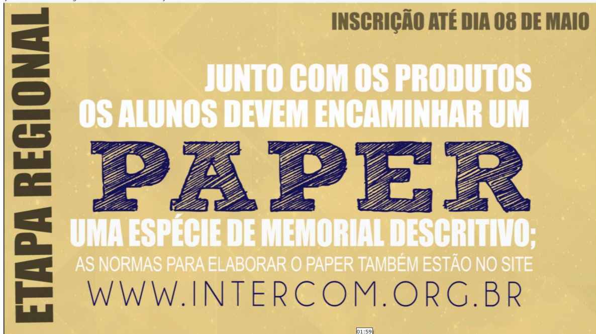
Imagem2: Captura de frame do Vídeo de Cartela do Expocom Sudeste 2015.

Imagem1: Captura de frame do Vídeo de Cartela do Expocom Sudeste 2015.