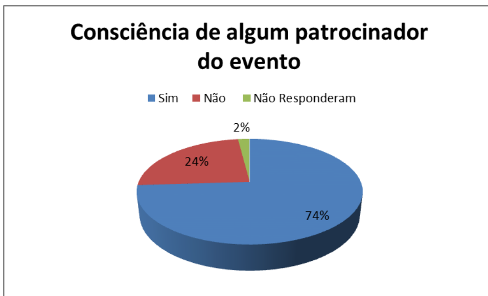
Gráfico 1 – Consciência dos patrocinadores do evento

No que diz respeito à pergunta relativa à consciência de marca dos patrocinadores da Maratona de São Paulo, 74% dos respondentes afirmam lembrar algum patrocinador do evento, enquanto somente 24% relataram não se recordar de nenhuma marca associada ao evento, 2% da amostra não respondeu a pergunta. Essas respostas podem ser visualizadas no gráfico 1.