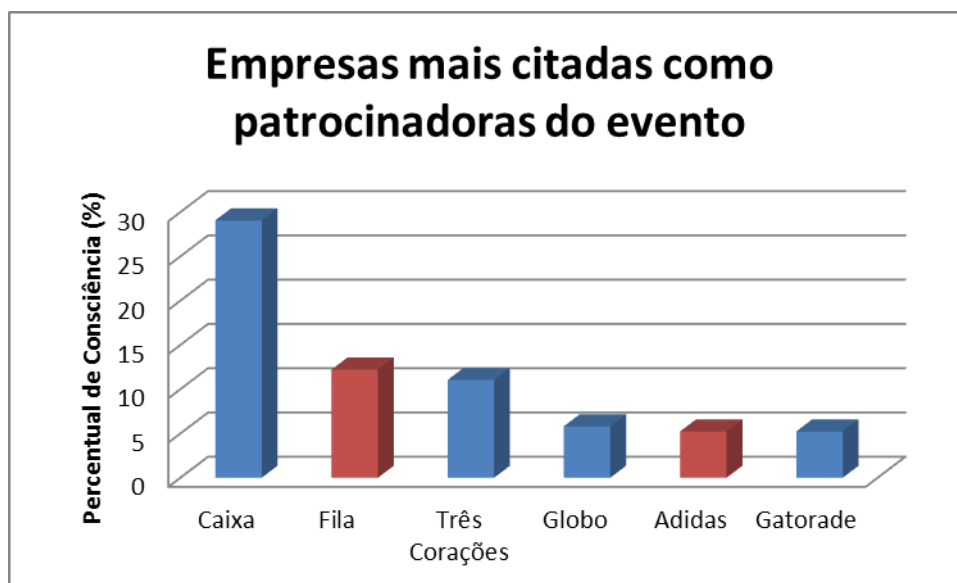
Gráfico 2 – Empresas mais citadas como patrocinadoras do evento

com 5,23 %. O gráfico 2 ilustra essas empresa citadas como patrocinadores do evento.