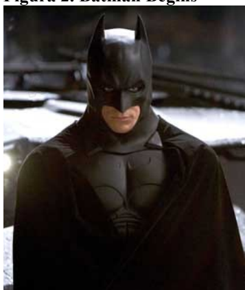
Figura 2. Batman Begins