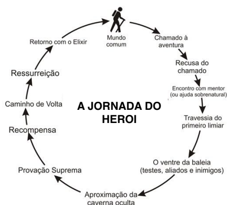
Figura 1. Diagrama da Jornada do Herói