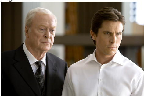
Figura 4. Alfred em Batman O Cavaleiro das Trevas