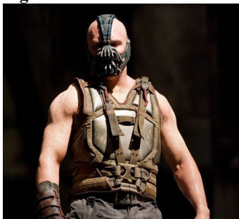
Figura 5. Bane em Batman O Cavaleiro das Trevas Ressurge