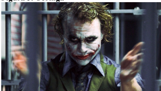
Figura 3. Coringa