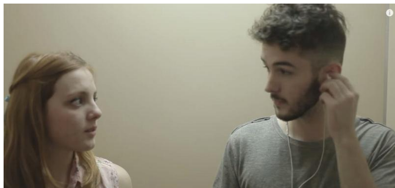
Figura 2 – Só sei dançar com você