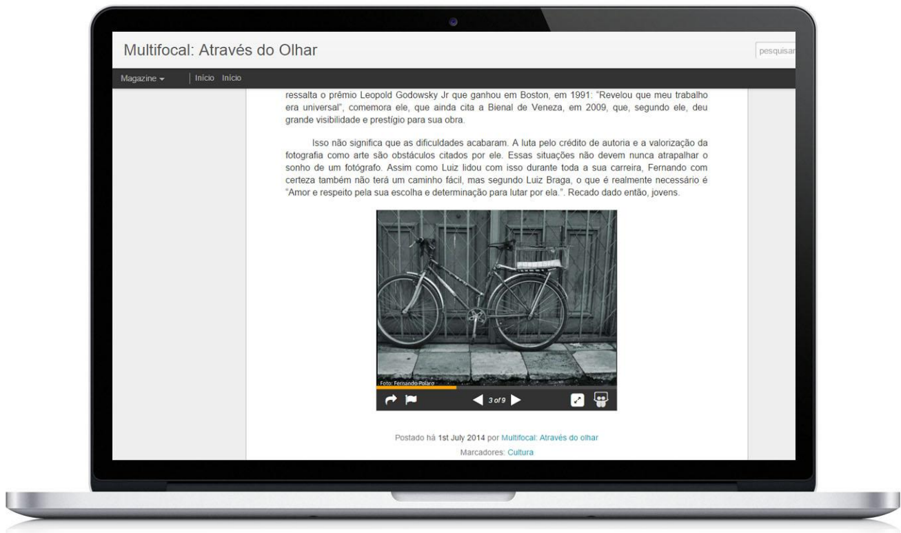
Figura 3. Uso do slideshare no post do blog Multifocal

Além de apresentar uma forma diferenciada de fazer o jornalismo, atrelando o texto a fotos, vídeos, infografias. O autor João Canavilhas explica essa nova fase do jornalismo em seu artigo “Do jornalismo online ao Webjornalismo: formação para a mudança”: