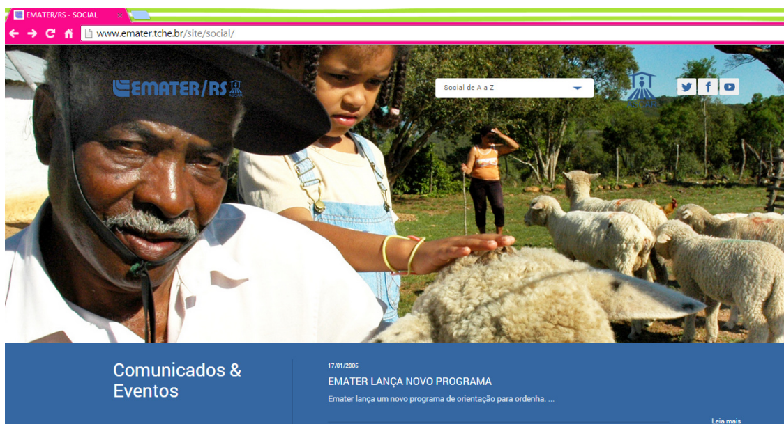
Figura 3: Site EMATER/RS- Ascar (Programas Sociais).

Entretanto, no site detectamos um grande problema de atualização dos programas sociais desenvolvidos pela EMATER-RS/ASCAR, tendo sua última postagem no ano de 2005. A falta de atualização dessas informações site induz a pensar que estas ações sociais pararam. Como sendo um programa social de tamanha importância de conhecimento para a sociedade atual, há a necessidade de mais investimentos nessa área do site, colocando os trabalhos realizados após os oito anos de sua última publicação.