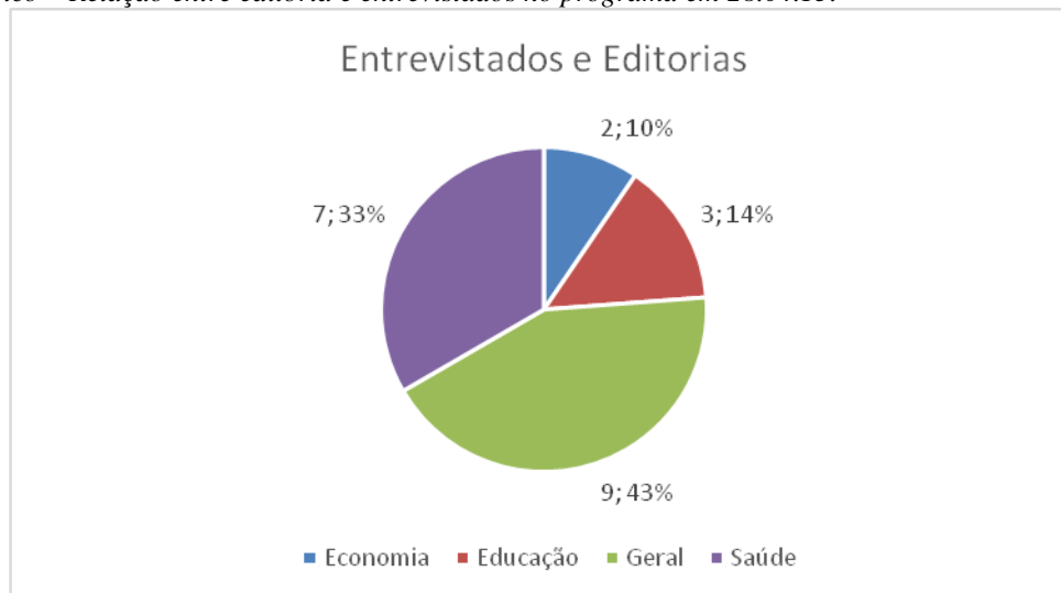
1.6 Gráfico – Relação entre editoria e entrevistados no programa em 28.04.15.

A partir da análise das quatro edições em dias aleatórios, constata-se que as fontes oficiais predominam na exibição do telejornal. O critério tempo de depoimento não foi contemplado neste estudo, o que pode vir a ser motivo de novas pesquisas.