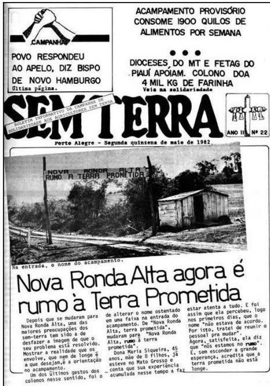
Fig. 2. Referências religiosas no boletim 22.

Após a organização nacional do movimento, em 1984, quando a própria CPT incentiva que os trabalhadores rurais criem uma organização independente da igreja, o MST distancia-se das ações vinculadas à Igreja, porém, em várias de suas práticas e políticas, como a de comunicação, ainda é possível encontrar essa influência.