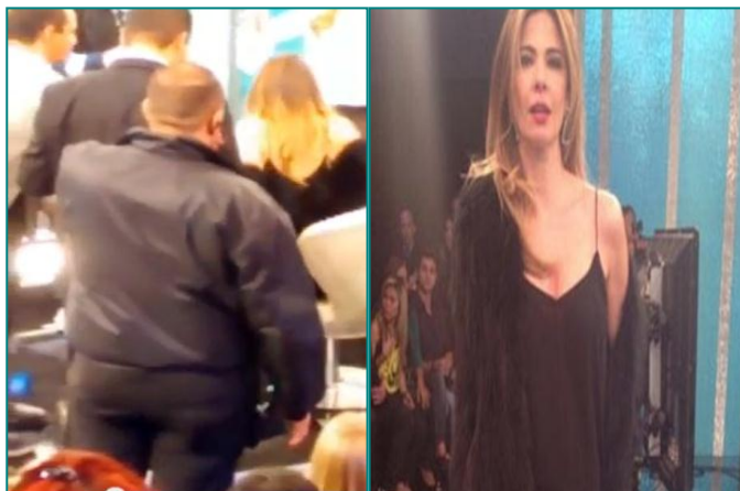
Figura - 4 Palco do Super Pop/ Figura - 5 Luciana Gimenez.

Publicação referente a Luciana Gimenez. É modelo, atriz e apresentadora da televisão brasileira. Em 15 de janeiro de 2001 estreou com o programa Super Pop na Rede TV e em agosto de 2006 se casou com Marcelo de Carvalho, dono da Rede TV.