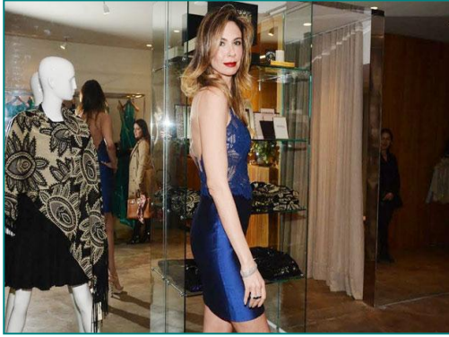
Figura 6 - Luciana Gimenez. No blog do Léo, apresenta como Luciana Glamurosa.

Seleção: uma característica peculiar do blog de Léo Dias é que ele não dá o furo, mas reconstrói a notícia sempre um dia após o ocorrido. Relata o fato na busca de outras formas para noticiar. No caso da publicação sobre Luciana Gimenez, a notícia vem para buscar explicação do fato, ou seja, rebate as acusações de desnutrição. O ponto de vista abordado é a saúde. Faz uma entrevista curta e explicativa, assim trouxe a versão da personagem dizendo que se descuidou da saúde por causa de uma gripe.