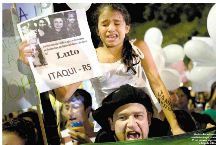
Figura 2 – Menina durante manifestação de luto 2