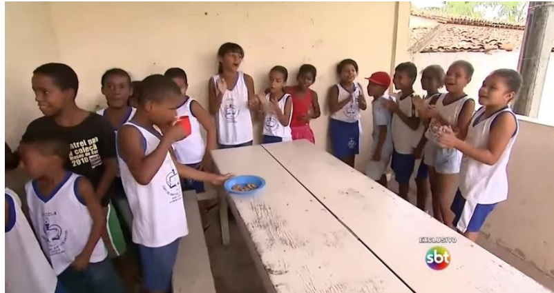
Figura 4 - Crianças cantam em comemoração ao alimento que irão receber.

considerando que choca e apela junto ao emocional do telespectador, já que há um contraste entre a escassez do alimento e a emoção das crianças, conforme mostra a figura a seguir: