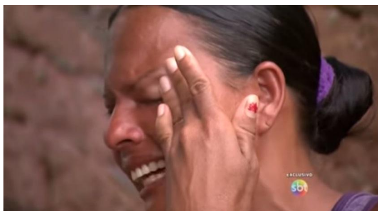
Figura 1 - Dona de casa lamenta a falta de alimentos para oferecer à família.

Na tentativa de mostrar que o esquema realmente atinge milhares de famílias, o programa utiliza imagens chocantes que demonstram o sentimento das pessoas envolvidas. Durante a visita a uma família, são registradas imagens de panelas vazias e a emoção da dona do lar é externada através de lágrimas. Da mesma forma, também é apresentada a cena em que uma criança chora pela falta do alimento. Para Canavilhas (2001), durante esta seleção de dramas humanos “procura-se explorar os sentimentos mais básicos da pessoa, pondo em destaque casos de insatisfação das necessidades básicas [...] nomeadamente as necessidades fisiológicas e a segurança” (CANAVILHAS, 2001, p.5). Estas imagens foram utilizadas de forma chocante e apelativa, conforme demonstra a figura abaixo: