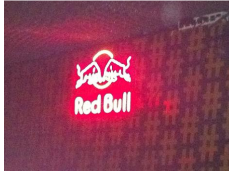
Figura 1 - Neón em clube paulistano 3

A marca utiliza de outros dispositivos ao se comunicar com outros públicos de interesse. No circuito esportivo, caracterizado por academias de ginástica e quadras poliesportivas, a marca se manifesta por meio de geladeiras de balcão e, mais raramente, por sampling realizado por promotoras de porte atlético. A narração utilizada pela marca é a da “disposição e energia”.