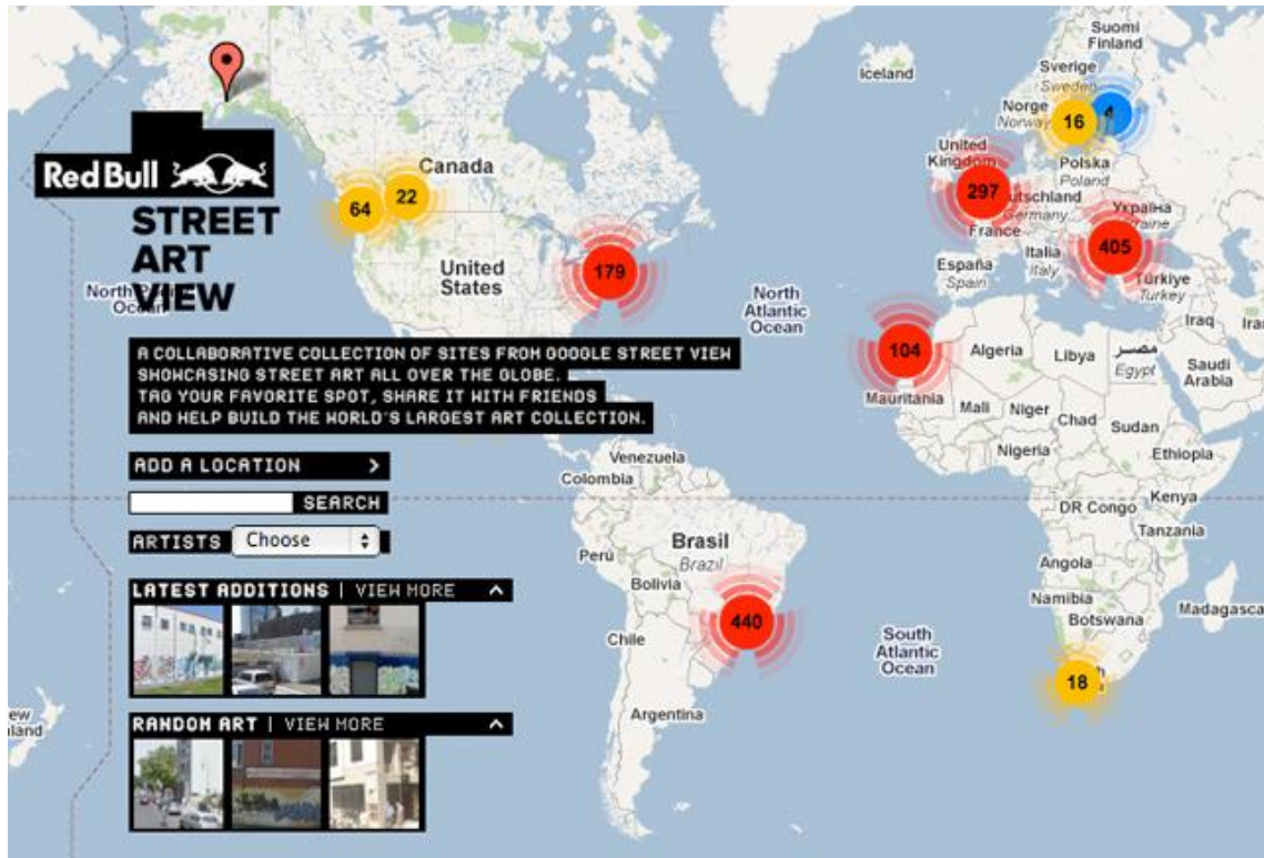
Figura 4 - página de abertura do Red Bull Street Art View 7

O projeto denota características típicas da rede e da marca: geração de engajamento, participação do consumidor, conteúdo gerado pelo usuário, visibilidade junto aos públicos, inovação e associação a temáticas inusitadas e que agregam valor de vanguarda à marca.