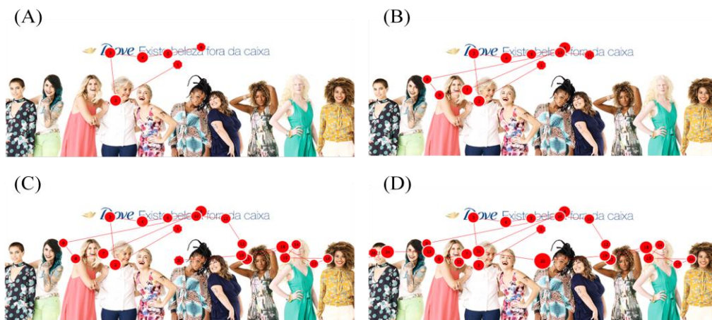
Imagem 2 – Exemplo de fixações de um sujeito na exibição de uma propaganda da marca Dove no eye tracker em 1 segundo (A), 2 segundos (B), 4 segundos (C) e 6 segundos (D). É possível verificar a lógica de “leitura” da imagem pelo sujeito.

dentro da realidade concreta. Porém, considerando que a inclusão de minorias na publicidade não garante a sua visualização, principalmente quando acompanhado de outras pessoas que não pertencem à mesma categoria social e que, mesmo que seja percebida, a imagem de um indivíduo de um desses grupos socialmente minoritários pode receber atenção diferente daquela destinada aos elementos pertencentes à categoria majoritária, nos parece cada vez mais relevante medir a atenção comparativa dada às faces de indivíduos presentes em peças publicitárias.