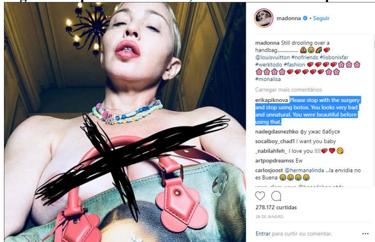
Figura 2. A polêmica da bolsa, do bico do seio e da aparência