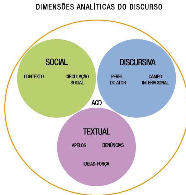
Figura 2: Dimensões analíticas do discurso