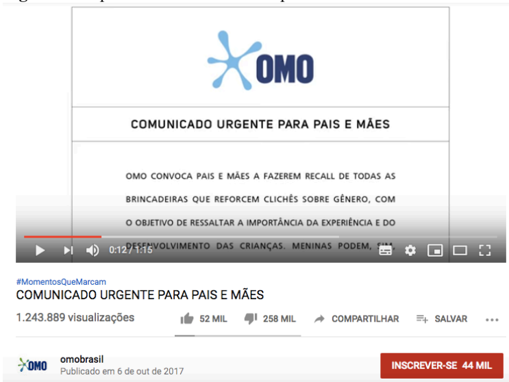
Figura 3: Impressão de tela do vídeo publicitário veiculado no Youtube