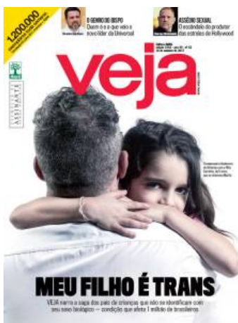
Figura 8: Capa da Revista Veja – edição 2552