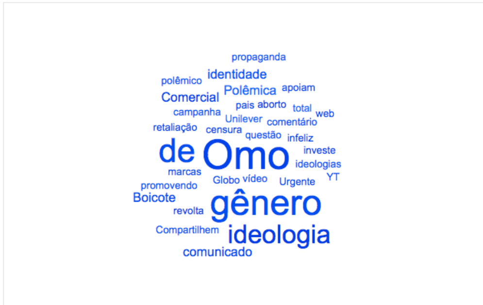
Figura 6: nuvem de palavras da parte azul do grafo – Vídeos “noticiam” a polêmica campanha de Omo