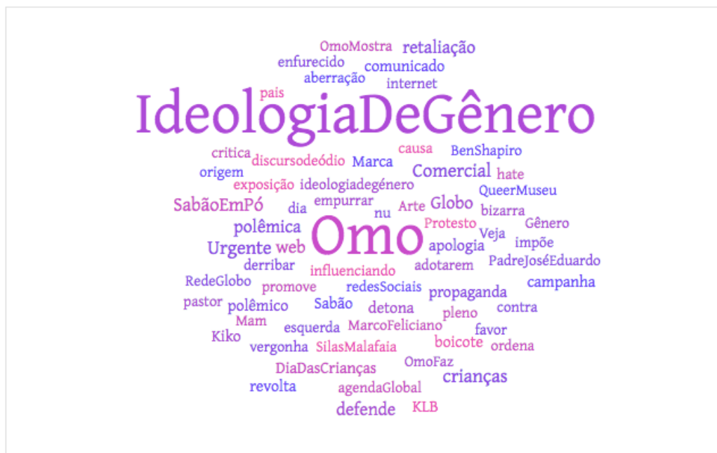
Figura 5: nuvem de palavras parte lilás do grafo – Omo: Consumo e Ideologia de Gênero