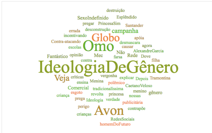
Figura 7: nuvem de palavras da parte verde do grafo – Associações a outras marcas e acontecimentos.