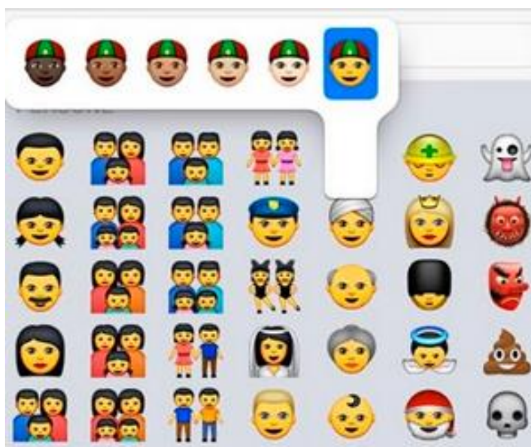
Figura 2 - Emojis de famílias de casais do mesmo sexo disponíveis no aplicativo

O aplicativo também trouxe a possibilidade de encontrar emoticons de famílias com casais do mesmo sexo para representar a diversidade sexual na sociedade e figurinhas de grupos geracionais para responder pela evolução dos recursos presentes no sistema operacional.