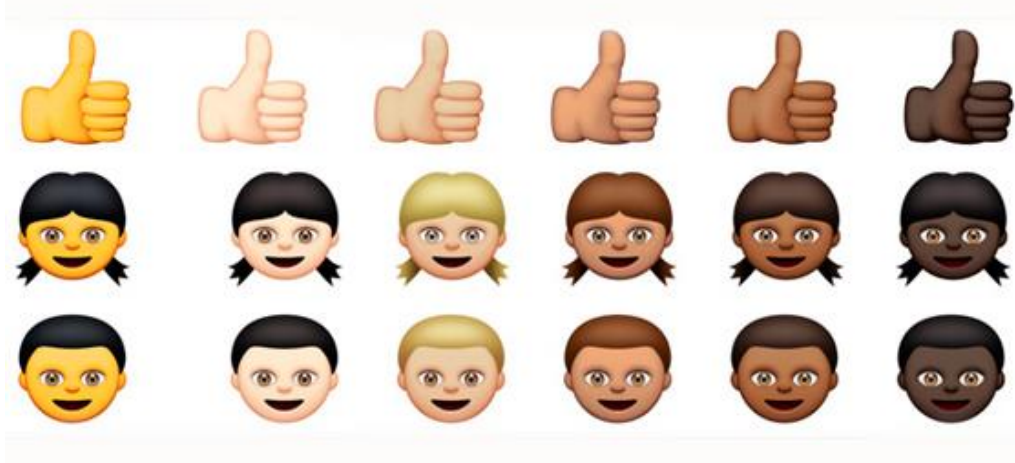
Figura 1 - Emojis com pessoas de cores diferentes disponíveis no aplicativo

Cada vez mais o grupo interagia, criando uma identificação com os recursos permitidos pelo aplicativo. E isso se acentuou quando os idealizadores do aplicativo perceberam a necessidade de adicionar símbolos e figuras que pudessem representar a diversidade da sociedade, e criaram, em 2015, os emojis étnicos para representarem os diversos tons de pele de grupos raciais.