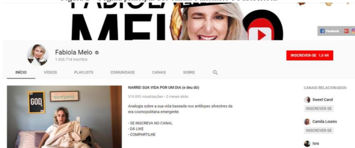
Figura 2 – Página principal dos canais Fafismelo e Fabibertotti

Mesmo os dois canais pertencendo a duas mulheres cristãs, eles se diferem bastante, desde enquadramento e cenário até linguagem e vestimenta, sem falar dos tópicos abordados e do modo como se expressam e revelam sua religiosidade em cada um deles. Cada youtuber trata das questões religiosas de uma perspectiva diferente, uma com seriedade e outra com mais humor, possivelmente, reflexos da idade e, principalmente, das intencionalidades de cada uma em relação ao seu canal – perceptível em seus vídeos de abertura, de apresentação (ver Figura 2).