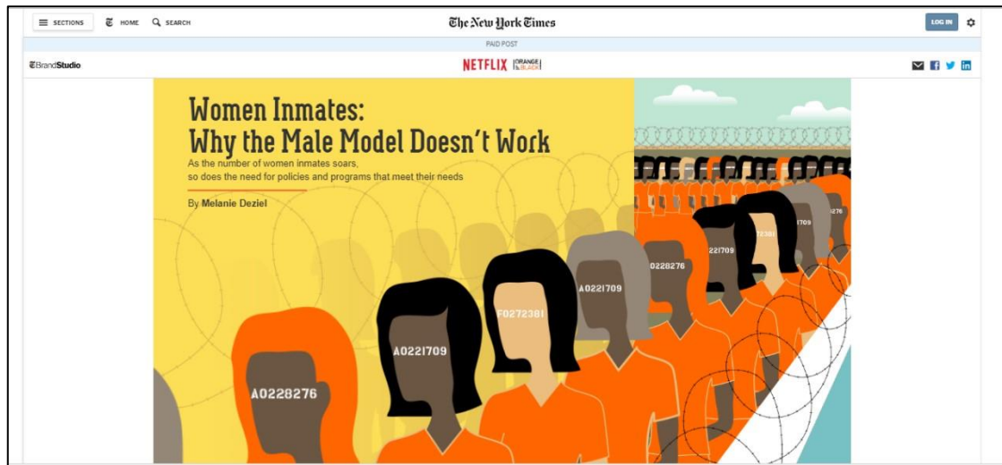
Figura 1. Reportagem hipermídia acima é um branded content do The New York Times sobre o sistema prisional feminino.