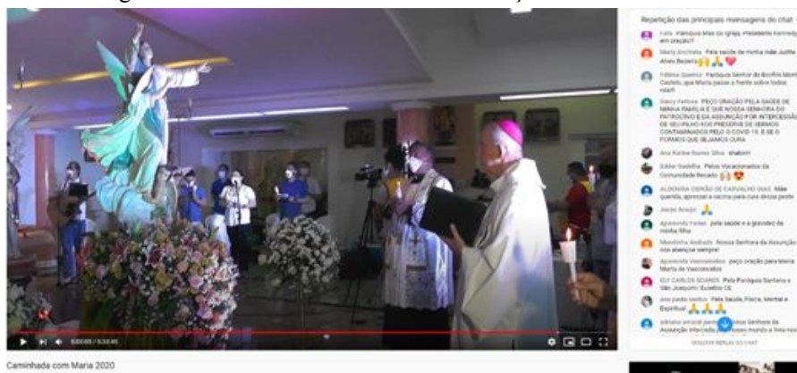
Figura 3 - Transmissão do evento e a interação dos fiéis

Virtual 2020 pelo canal do YouTube da Arquidiocese de Fortaleza. Com base na verificação dos termos mais frequentes, foram feitas algumas inferências acerca de como se deu a reconfiguração das práticas votivas e devocionais por parte dos fiéis participantes.