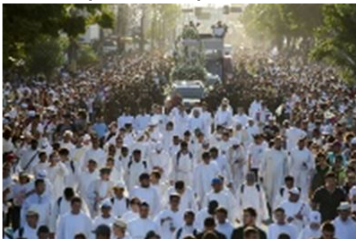
Figura 1 - Tradicional procissão de fiéis