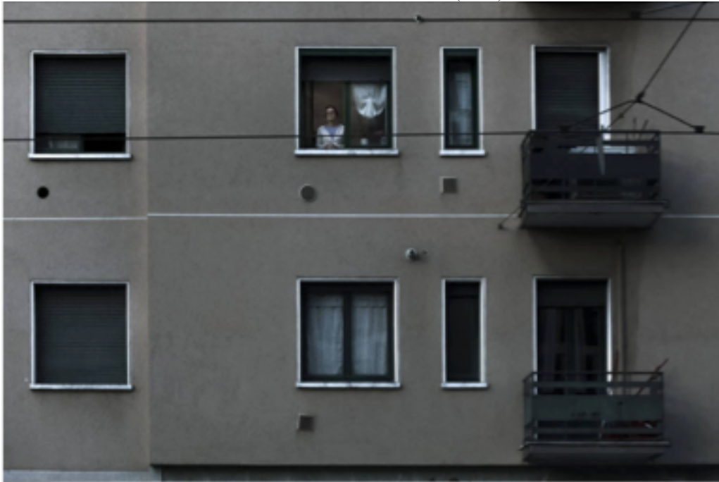
Figura 3: moradores são fotografados em suas janelas durante a quarentena na Itália.