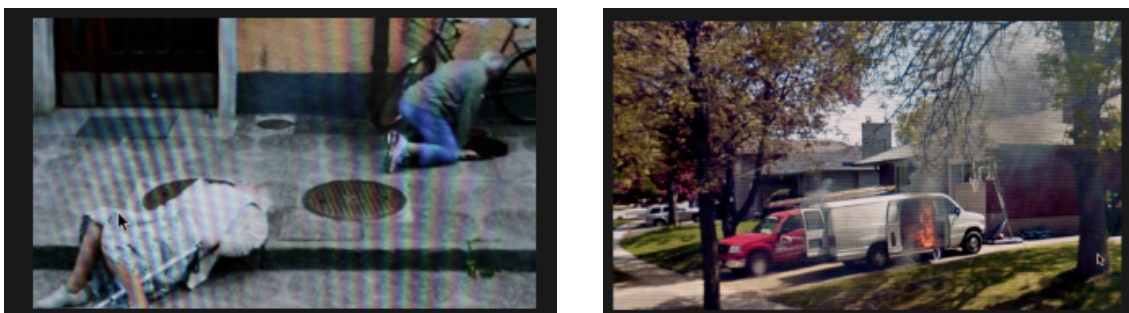
Figura 4: Imagens do trabalho A series of unfortunate events . Fotos Michael Wolf, 2010

Nesse sentido, por exemplo, torna-se pertinente comparar a mobilização tecnológica de Sandrini, baseada na captura de instantes na tela, àquela que o fotógrafo alemão Michael Wolf empreendeu, há dez anos, em seu trabalho A series of unfortunate events , também baseado em registros de telas, só que de flagrantes de apelo noticioso – como acidentes, incêndios ou cenas de violência–, que foram capturados na tela do Google Street View , igualmente por intermédio de uma câmera (figura 4).