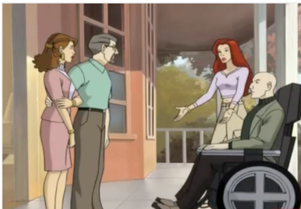
Imagem 2 - Série “X-Men Evolution” Warner Bros. Television Distribution