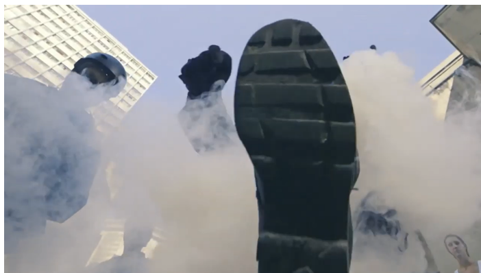
Imagem 12 - Cena da vinheta “A Televisão Tem Futuro?”