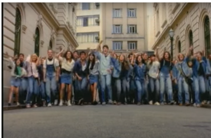
Imagem 8 - Cena do comercial “Passeata”, Staroup Jeans

Aos 3 segundos do vídeo, os jovens aparecem com televisores iconicamente substituindo suas cabeças. Estão posicionados como uma barreira. Vestem camisas brancas e jeans. Os televisores exibem algumas imagens do canal e algumas falas de VJs, em momentos que marcaram o canal. Do ponto de vista indicial, são críticas à situação que envolve o fim da MTV Brasil.