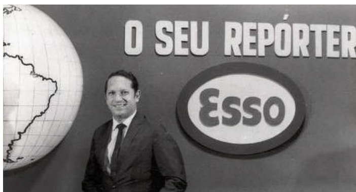
Imagem 11 - Repórter Esso