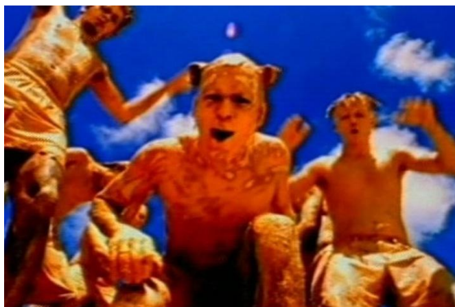
Imagem 1 - Videoclipe “Maracatu Atômico” de Chico Science e Nação Zumbi

No dia 30 de setembro de 2013, a MTV Brasil fez sua última transmissão, um programa transmitia ao vivo uma festa com ex-VJs que fizeram parte da história do canal. Para fechar a programação, Astrid Fontenelle, que, por sinal, fez a primeira aparição no canal, fez o discurso de encerramento, anunciando o último clipe exibido pelo canal, “Maracatu Atômico” de Chico Science e Nação Zumbi (Imagem 1). Terminava ali uma parte da história da televisão brasileira.