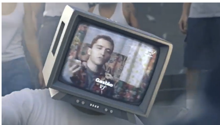
Imagem 7 - Cena da vinheta “A Televisão Tem Futuro?”

A vinheta é ambientada em um cenário de manifestações. Jovens molham as mãos em um líquido vindo de uma garrafa, o cenário é urbano e esfumaçado. Por meio do índice, é possível sugerir que o cenário retrata o momento vivido no país na época: as Jornadas de Junho. A audiência da MTV é formada basicamente por jovens, que, por sinal, também era o principal público presente nos protestos. A garrafa que aparece na imagem 6 é uma representação icônica do vinagre, amplamente utilizado para neutralizar os efeitos das bombas de gás lacrimogêneo, lançadas para dispersar a multidão e enfraquecer o movimento.