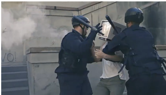
Imagem 9 - Cena da vinheta “A Televisão Tem Futuro?”