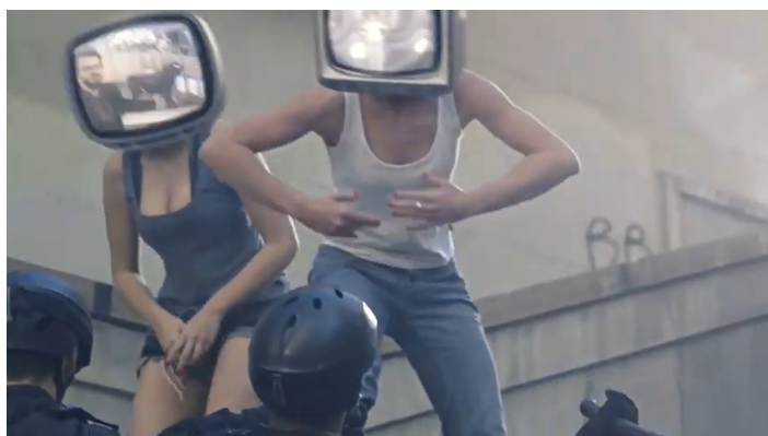
Imagem 10 - Cena da vinheta “A Televisão Tem Futuro?”