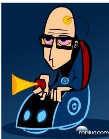
Imagem 4 - Cazé Peçanha em sua versão no desenho “Megaliga MTV de VJs Paladinos”