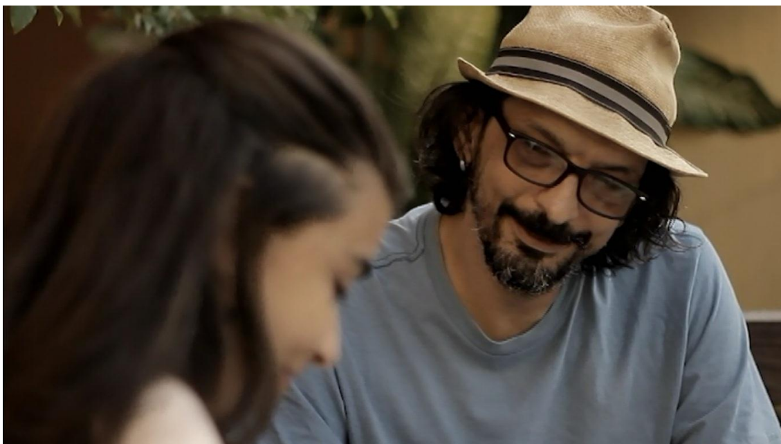
Figura 4: Fotograma do curta-metragem.