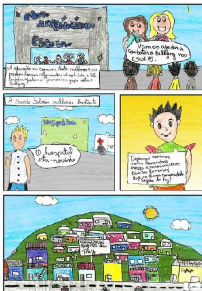
Figura 2: página de quadrinhos produzidas pelos alunos

O projeto obteve sucesso em seus objetivos, pois o aproveitamento dos alunos foi satisfatório, como pode ser comprovado pelo conteúdo e qualidade das histórias em quadrinhos produzidas nas escolas pelas crianças (Figura 2). Esperamos que o trabalho possa contribuir e estimular novos projetos voltados para educação infantil na temática de direitos humanos.