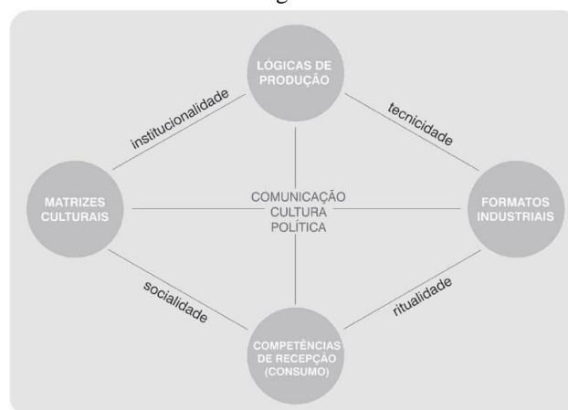
Mapa Noturno, de Jesús Martín-Barbero