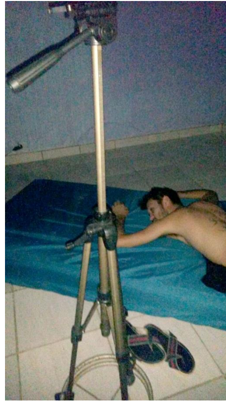
Figura 03: Cena sendo gravada, locação interna