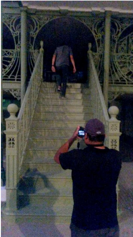
Figura 02: Cena sendo gravada, locação externa