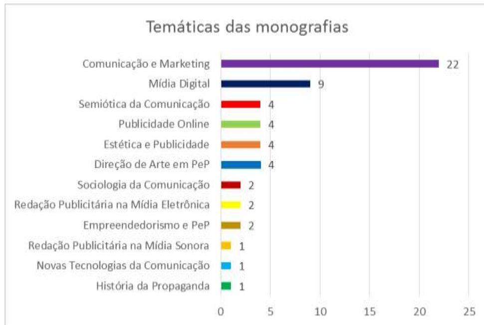
Gráfico 2- Classificação das temáticas das monografias