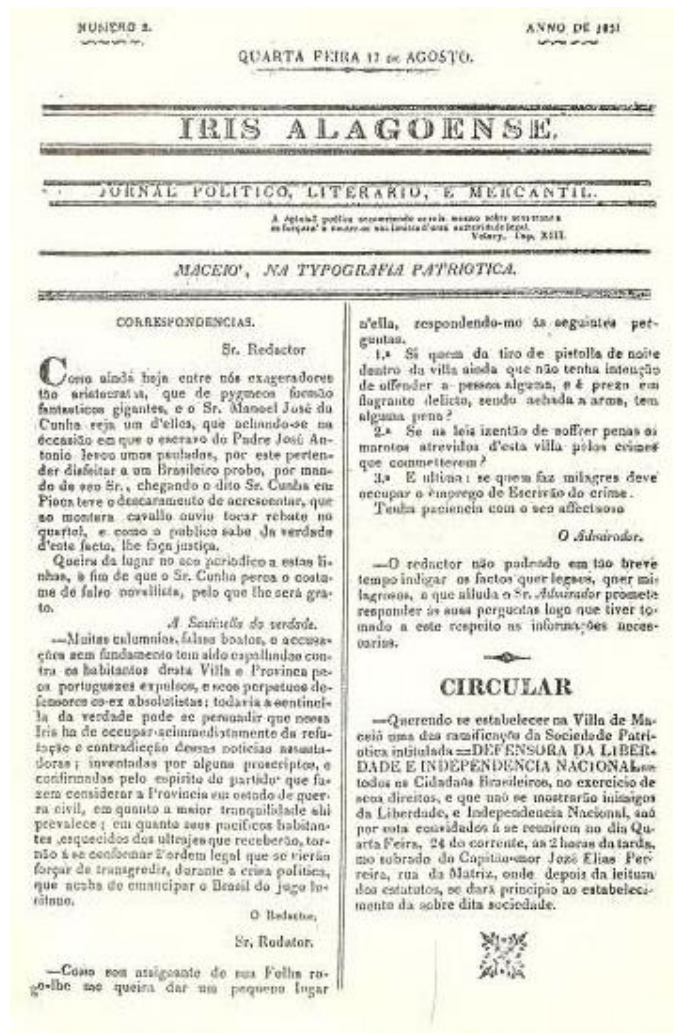
Imagem 1 – Capa da primeira edição do Iris Alagoense

A imprensa surgiu na antiga província das Alagoas, na Vila de Maceió, atual capital do estado, no dia 17 de agosto de 1831, com a tiragem do segundo número do jornal Iris Alagoense , já que o primeiro foi impresso no estado da Bahia, em data até hoje desconhecida.