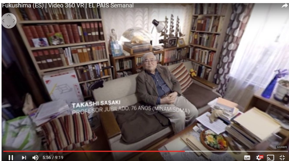
Figura 3 - Narrativas em 360 graus no El País