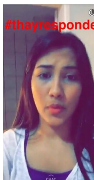
Figura 3: Printscreen do quadro de Thaynara OG no Snapchat , chamado “Thay Responde.”