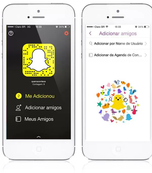
Figura 1: Tela de celular mostrando a interface do Snapchat .

Lançado em 2011, o Snapchat foi criado e desenvolvido pelos estudantes da Universidade Stanford, Evan Spiegel, Bobby Murphy e Reggie Brown. Segundo Evan Spiegel em entrevista à Forbes em 2014, “não éramos descolados, então tínhamos que fazer coisas que fossem”, partindo disso surgiu o aplicativo. O nome vem do termo inglês snap , que no português se refere a algo que acontece de forma repentina, o que é totalmente compatível com o objetivo do aplicativo, possibilitando aos usuários o compartilhamento de fotos, vídeos ou mensagens instantâneas.