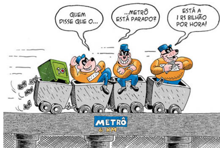
Figura 1 - Cartum critica os gastos nas obras do metrô. (Imagem Política Livre)

O metrô foi símbolo de modernidade na Europa em 1863, com a inauguração do sistema de transporte na cidade de Londres, Inglaterra. Cidades como Nova York e Buenos Aires inauguraram os seus sistemas metroviários em 1904 e 1913 22 respectivamente, enquanto no Brasil o primeiro projeto para construção de um sistema metroviário data de 1927, que só foi inaugurado 47 anos depois, em 1974, na cidade de São Paulo, após seis anos de obras, no período do milagre econômico promovido pela Ditadura Militar, com a abertura da economia nacional para o capital estrangeiro 23 .