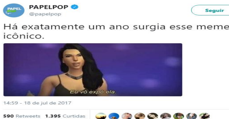
Figura 8: meme “Eu vou expor ela”

E o fato da narrativa se apropriar do reality show keeping up with theardashians foi tão inédito que viralizou em outras redes sociais, então, pessoas criaram memes a partir das cenas e compartilharam em seus perfis. O meme mais compartilhado nas redes sociais, principalmente no twitter, foi a imagem da Kim Kardashian falando “Eu vou expor ela”, uma alusão exata a atitude que ela teve em relação a cantora Taylor Swift. Então, o meme e o bordão produzido a partir da narrativa no canal RaoTv teve uma grande repercussão no twitter, o que garantiu bons números de visualizações no vídeo postado no youtube.