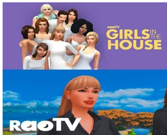
Figura 1: Capa não oficial GITH

Paralelamente à websérie, o canal lança ocasionalmente o Disk Dunny, que são spin offs (vídeos curtos que se originam de uma série) tendo a personagem Dunny como protagonista, sempre evidenciando em tom cômico sua personalidade forte, egocentrismo, ironias e ofensas. Os episódios giram em torno de temas diversos, mas sempre tendo a cultura pop como cenário principal para construção de conteúdos. E fazer alusão a personagens da cultura pop foi um fator decisivo no sucesso de seu canal, pois foi a partir dos spin-offs que o canal RaoTv atraiu visibilidade para a série, o que normalmente na tv seria ao contrário. Isso evidencia uma particularidade do canal: o usuário não é obrigado a ter um conhecimento prévio da série para entender a narrativa do spin-off , pois eles não fazem alusão integralmente a narrativa da série, ou seja, há uma mesclagem das personagens oriundas Girls In The House com inseridos nas narrativas dos artistas pop representados no episódio.