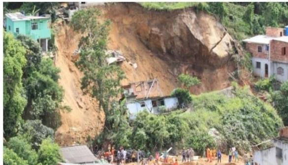
Uma pedra rolou do alto do morro e atingiu casas durante a madrugada