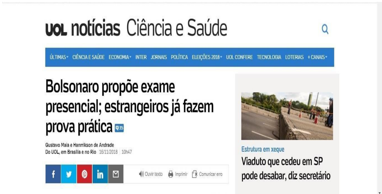
Imagem 03:

Portanto, o próximo recurso de multimídia analisado foram os podcast utilizados pelo veículo. Neste ponto, é perceptível que o meio de comunicação não utiliza-se de áudios na home, porém todas as matérias analisadas o veículo disponibiliza o recurso intitulado pelo próprio veículo como “ouvir texto”, sempre atualizado, disponibilizando título, autoria do texto e matéria completo, porém é relevante destacar que não há créditos para aquele que está lendo o texto, sendo inviável a colocação de Palacios (2011), para saber se o texto e áudio são do mesmo autor.