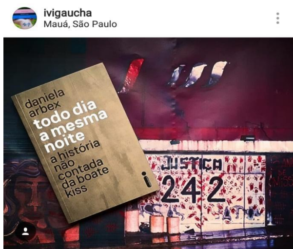
Figura 1: “Esse livro me fez chorar, mas além do desalento, me fez experimentar outros sentimentos como dor, sede, falta de ar, revolta e lá no fundo, um pontinho de esperança”

Segundo Quéré (2010, p. 20), “prestar conta da experiência é descrever uma vivência ou um sentido subjetivo, ou ainda restituir aquilo que foi sentido, experimentado, ou uma percepção subjetiva da situação”, e uma vez que essa experiência é compartilhada, mantém-se a história contada e os assuntos discutidos em constante pauta. É ainda uma maneira de que mais leitores tomem pra si essa experiência e a passem adiante.