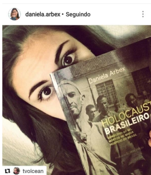
Figura 3: "Ainda consigo sentir o cheiro nauseante do Colônia mesmo após sua extinção"