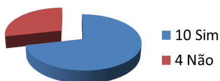
(Gráfico 01 – Rádios com acesso na internet)