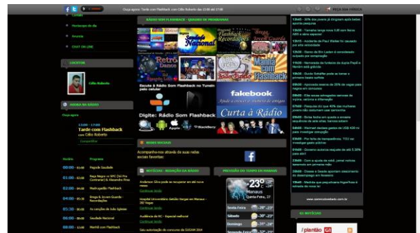
(Figura 04 – Site da Rádio Som Flashback)

As atividades começaram em 2012, sendo considerada uma emissora de rádio com presença exclusiva na internet de acordo com Prata (2008). Com uma equipe reduzida, começou como um passatempo, e é mantida com colaboração financeira de pessoas próximas. No site podem ser encontrados vários elementos como: