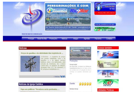
(Figura 01 – Site da Rádio Rio Mar)

No ar desde 1954, foi em 2007 que a emissora ficou disponível via internet, em tempo real pelo site. É considerada uma emissora de rádio hertziana com presença na internet de acordo com o conceito de Prata (2008). A rádio pertence a Arquidiocese Metropolitana de Manaus.