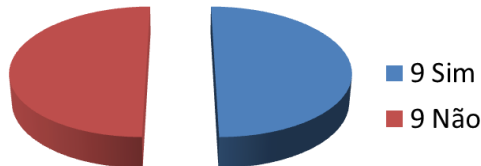
(Gráfico 03 – Webrádios com acesso na internet)