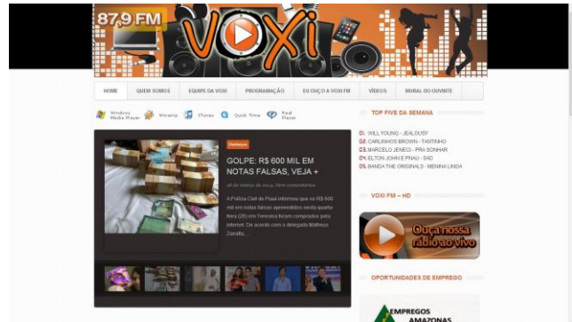
(Figura 03 – Site da Rádio Voxi FM)

A Voxi FM começou as suas atividades em janeiro de 2011 e em maio do mesmo ano passou a transmitir também via FM, inserindo-se numa proposta de rádio comunitária. Inicialmente considerada como emissora de rádio com presença exclusiva na internet, depois passou a ser uma emissora de rádio hertziana com