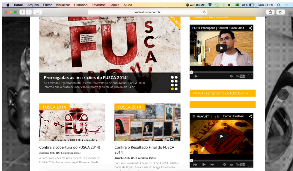
Site oficial do festival