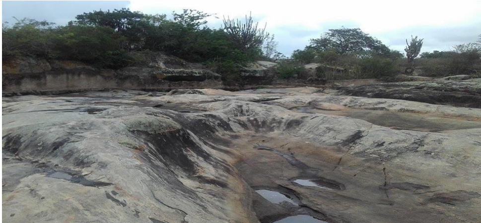
FIGURA 02 – Formações rochosas dos tanques

nesse lugar. O chão de pedras e a vegetação escassa da região se destacam dentro da caatinga.