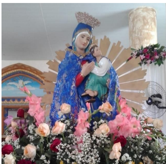
FIGURA 07 – Imagem de Nossa Senhora do Perpétuo Socorro

Se por um lado a igreja “mãe” mantém por anos o envolvimento dos casserengueses com a fé que aquele lugar proporciona, por outro não podemos observar quando olhamos para as ruas e casarões da cidade, que ano após ano em algumas construções que acompanharam o surgimento da cidade e principalmente nos tempos da elite de fazendeiros, desapareceram ou estão ameaçadas de desaparecer da memória da cidade.