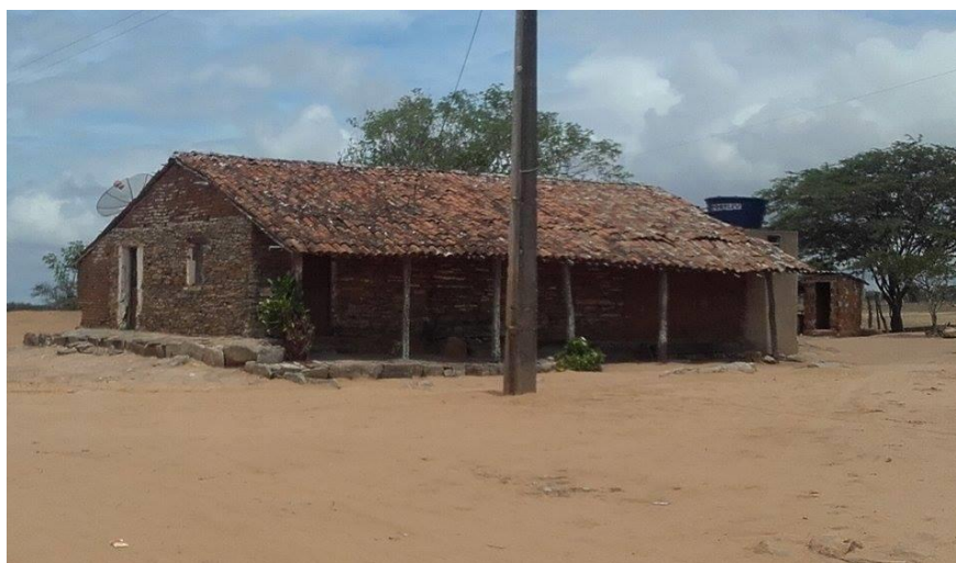
FIGURA 05 – Casa de Pedra

Sua estrutura inicial é feita completamente de pedras, tiradas das matas da propriedade da família, que compreendiam os sítios Valério, Serra Branca e uma parte de Casserengue. Desde então, aos cuidados da administração pública, a "Primeira Casa" não teve função específica, nem utilização adequada.