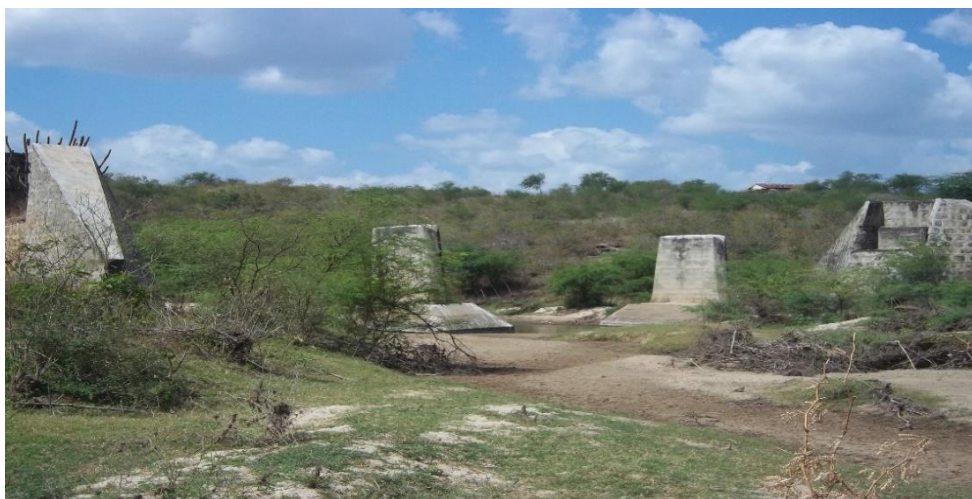
FIGURA 04 – Ruínas da Ponte Férrea

Para cruzar essa região foram usados cortes, aterros, pontilhão e a ponte férrea sobre o Rio Salgado. Segundo moradores antigos os cortes de terra eram cavados manualmente e para quebrar as pedras usavam-se bombas e a terra era retirada de jumentos.