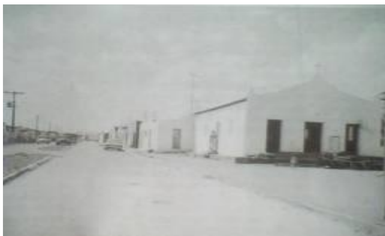
FIGURA 06- Centro do Distrito de Casserengue/ 1ª Igreja