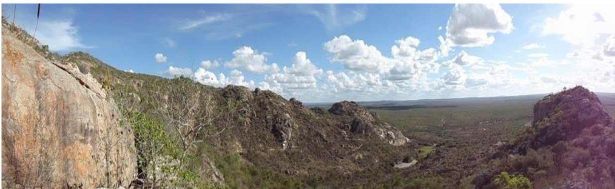
FIGURA 01- Vista posterior da Serra da Caxexa