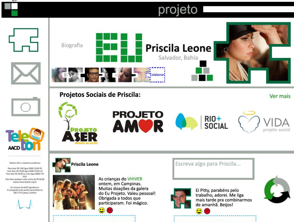
Figura 4 ó Perfil do usuário

Conforme se observa abaixo, a Figura 5 apresenta como é a página do perfil de uma organização, ou seja, de um projeto social: