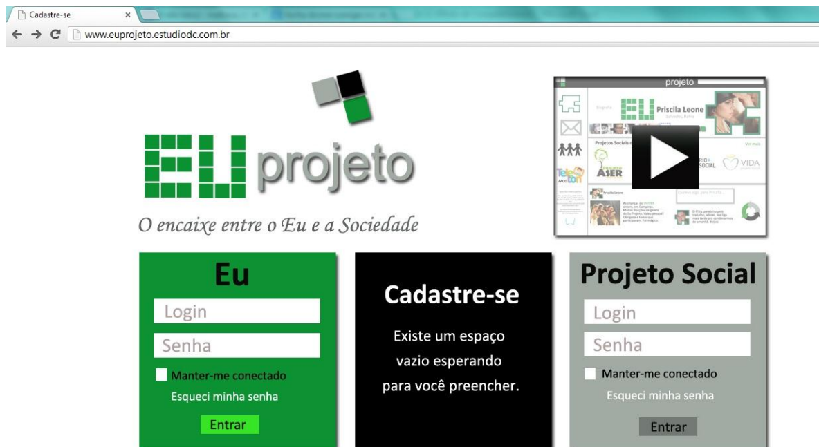
Figura 2 ó Página Principal

Ao fazer o login , o usuário é direcionado para sua página inicial, conforme pode ser visualizado na Figura 3. Na página inicial, o usuário visualiza suas mensagens e seus novos colaboradores (amigos). Não é preciso aceitar essa amizade, a colaboração não é um pedido, é uma participação nos perfis dos cidadãos e instituições que simbolizam a cooperação entre eles. O usuário também tem acesso às suas atualizações, que são representadas pelo ícone em forma de ponto de exclamação, para dar ênfase de importância e atualização. A participação do usuário na mídia digital é medida pelos projetos sociais que ele já participou e pelas ajudas que ele forneceu. É representada pelos blocos da logo, formando uma pirâmide de seis blocos. Um usuário que tenha pouca participação terá