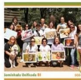
Seminário Unifield 01

IMPRENSA NO BANCO DOS RÉUS Por Dany Starling João Luis Chagas - Jornalismo praticado no Brasil é visto com desconfiança pela população e busca novas fórmulas para recuperar sua credibilidade. Jornais impressos, Revistas, Rádio, Televisão, Sites e portais, Redes sociais. Qual o meio mais eficaz na hora de informar? Onde conseguir as melhores e mais detalhadas notícias? As opções são vastas. A gama de veículos informativos à disposição do brasileiro cresce a cada dia, a ponto de ser praticamente impossível acompanhar tudo que está acontecendo, seja em nossa cidade, estado, país ou no mundo. A quantidade, contudo, nem sempre vem atrelada à qualidade. Isso talvez explique a atual relação das pessoas com a imprensa. Esta, que já foi considerada o Quarto Poder, capaz de derrubar presidentes, abalar a economia e influenciar diretamente o comportamento alheio, vem perdendo sua credibilidade e prestígio junto aos brasileiros, que confiam cada vez menos no que leem, assistem ou ouvem nos jornais. No último mês de setembro, o Portal Imprensa divulgou uma pesquisa feita pelo Ibope que revelou o aumento da desconfiança do