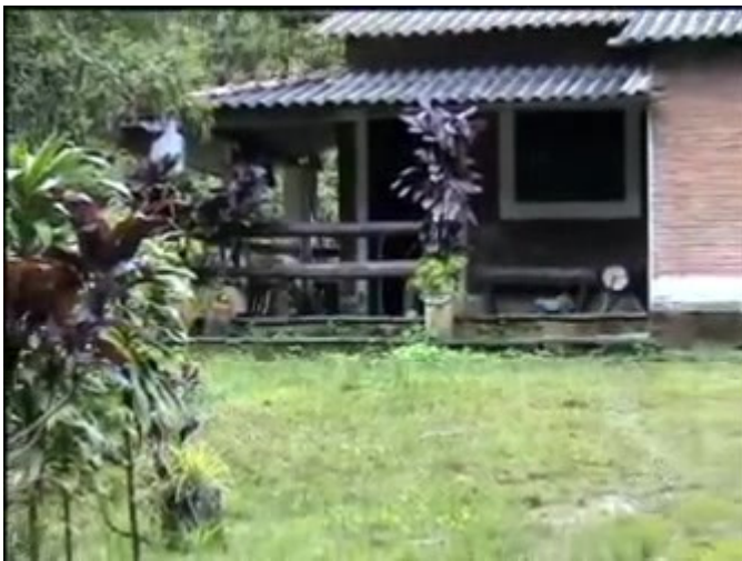
Figura 2: O sítio 31 de março: o olhar subjetivo se transmuta em um ponto de vista objetivo do narrador-repórter

simplesmente, já que os instrumentos de visibilidade se definem, com mais frequência, no auxílio da imagem e da autenticidade da história. A narração over (ou em off ) em Os porões da tortura resolve esse aspecto, pois coloca “acima” um repórter que olha de fora os trabalhos da equipe (dos produtores, mais especificamente, à procura de dados precisos para a confecção do texto telejornalístico), ao preencher um discurso que se emana na localização das fontes e nas evidenciações dos espaços de representação (seja das tomadas cênicas, seja das passagens realizadas, por exemplo).