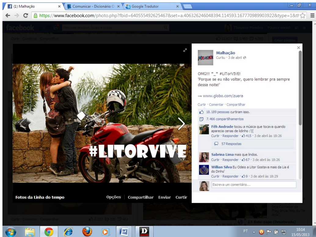
Figura 1 Postagem retirada do facebook de Malhação 14

Abordando a linguagem jovial que desenvolve um novo modo de inteirar através da rede, podemos citar o filósofo e pensador francês Michel Foucault (2011), que em seu livro A ordem do discurso , apresenta os diferentes discursos que permeiam a sociedade, como: autoritários, críticos e legitimados de poder, porém todos nós temos a autoridade do discurso, possuímos a linguagem, a contingência de trocar informações com os outros indivíduos.