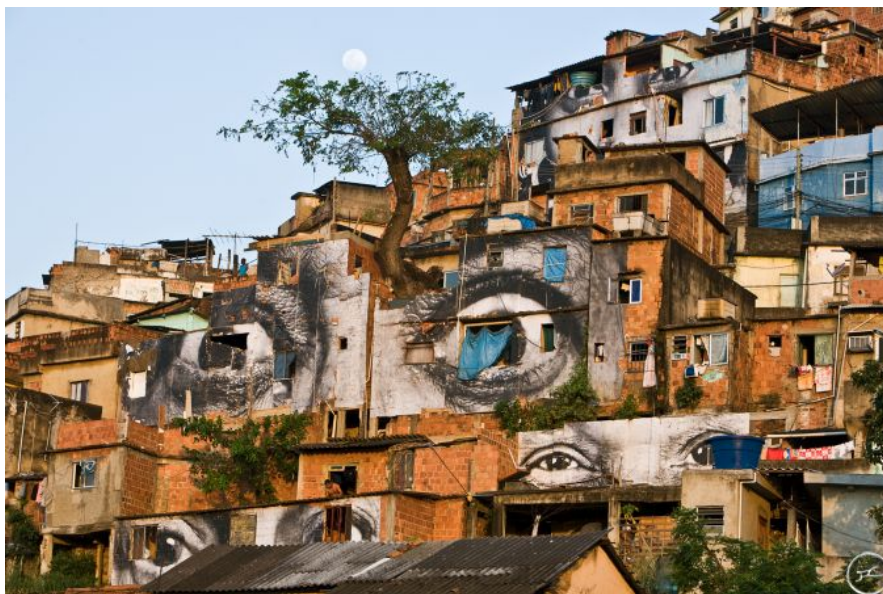
JR - Action dans la Favela Morro da Providência, Arbre, Lune, Horizontale, Rio de Janeiro, 2008. 7

As fotos escolhidas para análise foram tiradas no Brasil, no ano de 2008, na favela Morro da Providência, localizada no Rio de Janeiro. Com base nas reflexões apresentadas por Jaques Rancière (1995, 2000, 2010), acreditamos ser possível afirmar que JR promove uma ação política ao conferir visibilidade a essas imagens de modo que elas convoquem os espectadores a se posicionarem não só diante delas, mas de uma forma de capturar o outro em sua diferença, estranheza e singularidade.