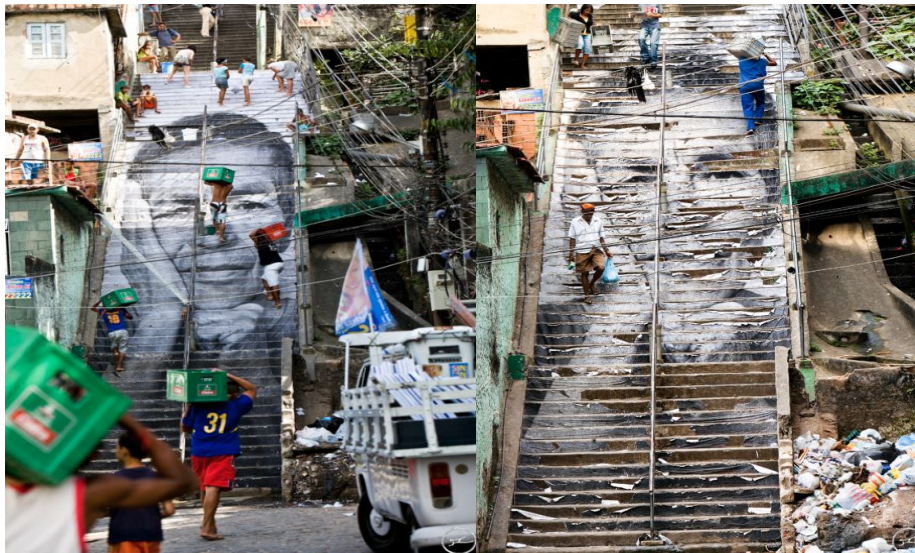
JR – Action dans la Favela Morro da Providência, Escalier, Rio de Janeiro, Brésil, 2008

O modo como JR fotografa as mulheres do Morro da Providência dá origem a um gesto transformador que se realiza por uma dupla via: pela arte, que fornece estratégias originais de expressão discursiva (em vez do lamento), e pela política, que instaura um conflito acerca do que significa falar, assim como sobre os horizontes de percepção que distinguem o audível do inaudível, o capaz do incapaz, o igual do desigual, o compreensível do incompreensível, o visível do invisível. "O fotógrafo atua como mediador cultural ao traduzir em imagens técnicas sua experiência subjetiva frente ao mundo social." (MAUAD, 1969, p.5)