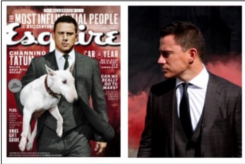
Figura 1. Capa da edição da Esquire (esq.) e imagem do vídeo de introdução, na vertical (dir.)

Apesar da qualidade da imagem e da estética cinematográfica utilizada, é possível perceber que o vídeo foi gravado em formato vertical, fora do padrão de proporção de 16:9 convencional pelo cinema e pela televisão digital. Neste caso, o material foi elaborado para se adequar ao formato da tela do tablet em sua posição vertical, a mesma posição de leitura de uma revista impressa.