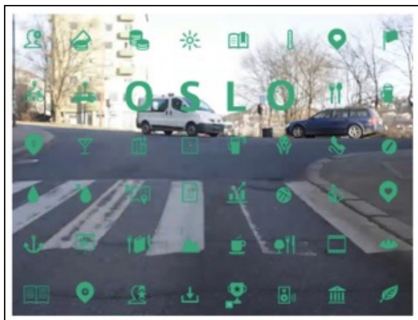
Figura 5. Reportagem interativa sobre Oslo, com combinação de vídeo, texto e ícones

Outra utilização dos recursos audiovisuais que merece destaque está na matéria intitulada “Oslo”, que fala dos principais aspectos desta cidade. Para isso os editores criaram um vídeo de um tour pela cidade em time-lapse . Na tela são exibidos vários ícones, enquanto o vídeo roda ininterruptamente. Cada ícone corresponde a um aspecto relacionado à cidade, como alimentação, segurança, habitação, custo de vida, entre outros. Somente ao tocar em um destes itens, um breve texto sobre o assunto em questão é exibido. Uma solução muito criativa, tanto no aspecto estético quanto na funcionalidade, pois os elementos combinam bem entre si, e ocupam harmoniosamente o espaço da tela, sem que um ofusque o outro. A combinação destes dois elementos oferece ao leitor uma compreensão ainda maior sobre a cidade, uma vez que, ao visualizar o vídeo, ele tem a sensação de estar trafegando de carro pelos bairros e, ao clicar nos ícones, obtém informações e dados sobre a mesma, como se estivesse imerso em um mapa virtual informativo e audiovisual.