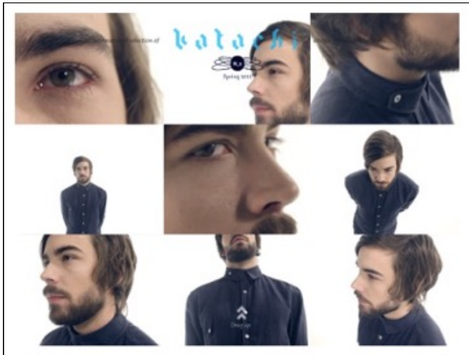
Figura 3. Capa da edição da Katashi, com orientação horizontal

A edição analisada tem como tema principal a origem das coisas que nos cercam na contemporaneidade, ligando produtos às suas fontes, movimentos à ideias e conceitos que os originaram e pessoas às suas origens. Todas as edições são desenvolvidas para leitura na posição horizontal, não permitindo a leitura na vertical ( Figura 3 ).