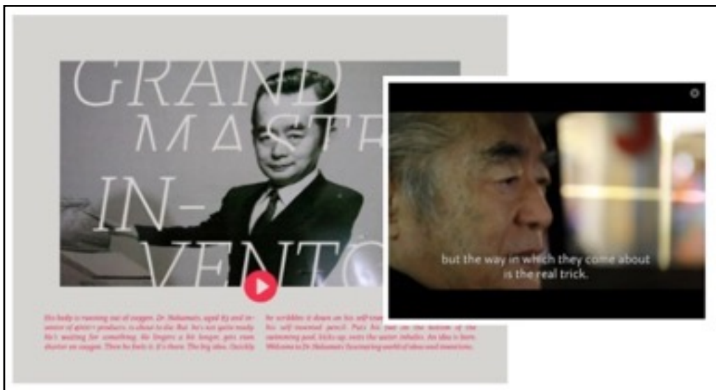
Figura 4. Reportagem com recurso de vídeo (esq.) e player exibido em tela cheia (dir.)

Os recursos audiovisuais estão fortemente presentes na revista e, em alguns casos, funcionam como o elemento principal do assunto abordado. É o que ocorre na matéria intitulada “Grand Master Inventor”, por exemplo, que conta a história do Dr. Nakamats, um senhor japonês detentor de mais de quatro mil registros de patentes. A matéria conta com um vídeo de cerca de 5 minutos, em formato de documentário, onde o próprio Dr. Nakamats narra parte de sua história, contada em off e coberta por imagens 10 (Figura 4). Além do vídeo, a matéria conta apenas com um parágrafo de texto e uma timeline , na qual se pode visualizar, ao deslizar-se, algumas das principais invenções em ordem cronológica.