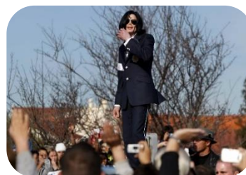
Imagem 10

A fotografia do dia 16 de janeiro de 2004, mostra Michael Jackson interagindo com seus fãs, no topo de sua limusine, após ser absolvido de acusações de abuso infantil, na Califórnia, no tribunal Santa Maria.