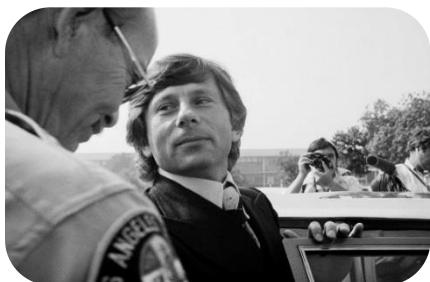
Imagem 7

Em 25 de outubro de 1977, Nick registra o diretor de cinema Roman Polanski, que no momento da foto estava deixando a corte em Santa Monica, Califórnia, após uma audiência relacionada às acusações de que ele abusou uma garota menor de idade.