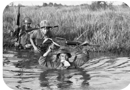
Imagem 3: 11 de março de 1972, soldado do Vietnã atravessa um rio.

Na primeira fotografia acima, vemos o rosto aflito de uma refugiada que segura seu bebe aos prantos, já na segunda foto, nota-se que os soldados se acostumaram a viver naquela situação, atravessando um rio com sua unidade, onde um deles carrega em sua boca um saco com seus pertences, e protegendo também seu instrumento de guerra: a arma.