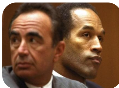
Imagem 8:

Já essa foto, de 26 de agosto de 1994, mostra OJ Simpson, jogador de futebol americano, e o advogado Robert Shapiro, durante o julgamento do ex- atleta que foi acusado de matar a facadas sua esposa.