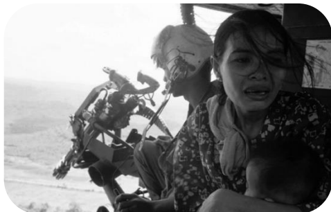
Imagem 2: 22 de março de 1975, uma refugiada segura seu bebê.

Assim, foi nesse cenário e ambiente de guerra que Nick fotografava, buscando mostrar as violências que ocorriam com um olhar jornalístico e de forma sentimental. Esse fotografo possui variadas fotos que mostram o desespero e horrores vividos pelas pessoas daquele local.