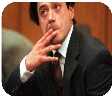
Imagem 9:

A foto ao lado, retrata o ator Robert Downey Jr, que atualmente interpreta o Homem de Ferro. Ele está em um tribunal de Malibu, no dia 8 de dezembro de 1997, escutando a sentença do juiz municipal, Lawrence Mira, antes de ser condenado a seis meses de prisão por violar sua liberdade condicional, após uma condenação por delito de drogas.