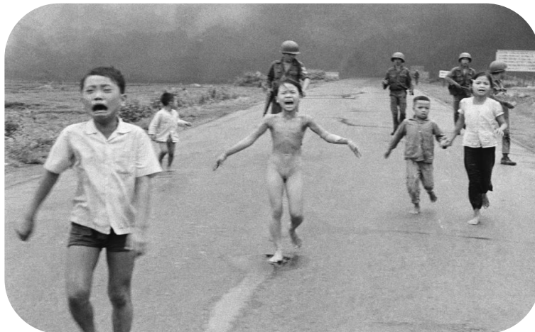
Imagem 4: 8 de junho de 1972, Menina de Napalm.

As imagens apresentadas são solenes, porém, há aquela que marcaria a vida do fotógrafo e da fotografada, intitulada como: “Menina de Napalm”. Analisando a fotografia, nota-se que no centro está uma menina, correndo nua por uma rua, em sua volta há outras crianças chorando e retratando assim, o terror do momento. Além disso, existem soldados armados na parte de trás e na extremidade superior contém uma fumaça, que foi consequência de uma bomba. A foto, como a maioria das fotografias de guerra de Nick Ut, possui um efeito em preto e branco, transmitindo de forma mais clara a mensagem de sofrimento que esse conflito causou, afetando até mesmo crianças.