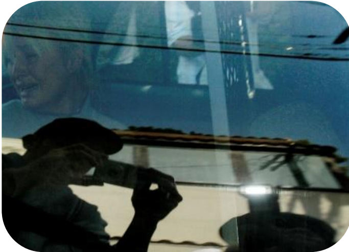
Imagem 11:

Contudo, na época de Hollywood, a foto mais famosa que Nick Ut retratou, é a imagem de Paris Hilton. A fotografia mostra a artista chorando em uma viatura policial, ao ser indiciada por conta de problemas com multas de trânsito. Foi um registro feito no dia 8 de junho de 2007, exatamente 35 anos depois da