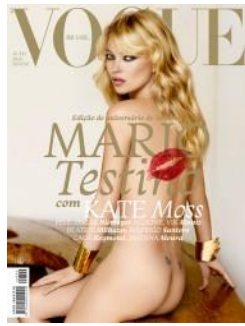
Kate Moss, Vogue Brasil, Maio de 2011.