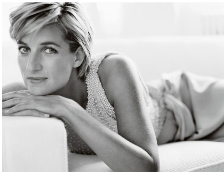
Princesa Diana, Londres, 1997.

Em 1997, Testino foi contratado para fotografar a princesa Diana por sua famosa capa da Vanity Fair . Com um jeito único de fotografar, ele capturou uma natureza descontraída e com um bom coração. Isso não só lançou sua carreira em aclamação internacional, mas também iniciou uma relação de longa data entre ele e a Família Real. A tarefa foi concluída cinco meses antes da morte trágica, e acabou sendo a última sessão oficial. Ele fotografou muitos membros da realeza, incluindo o príncipe de Gales, o duque e a duquesa de Cambridge, o príncipe Harry, o rei e a rainha da Jordânia entre outros.