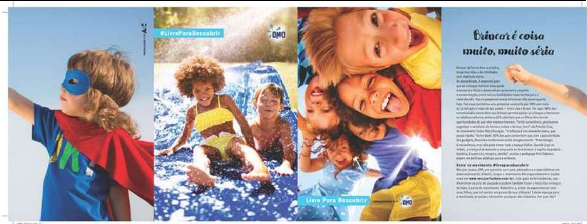
Figura 3: Coluna “Educar é coisa muito, muito séria”

O desafio da comunicação de marcas hoje é conseguir falar com vários públicos ao mesmo tempo. Foi-se o tempo em que as empresas decidiam falar com um público e silenciar as vozes em relação aos demais. Atualmente, as marcas falam para clientes que também são formadores de opinião. Falam para seus segmentos, para seus colaboradores e investidores, que por sua vez transmitem mensagens até outros públicos. Os discursos precisam ser consistentes e fazer sentido para qualquer público.