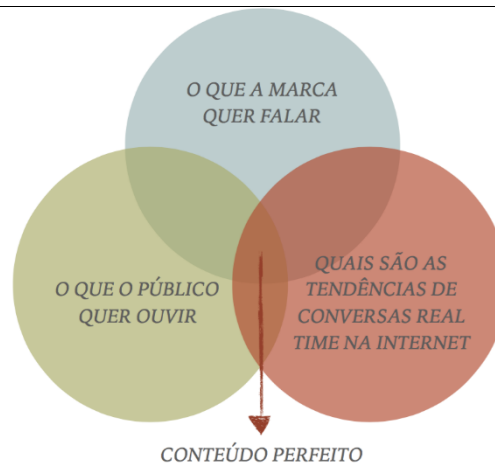
Figura 5 – Conteúdo Perfeito