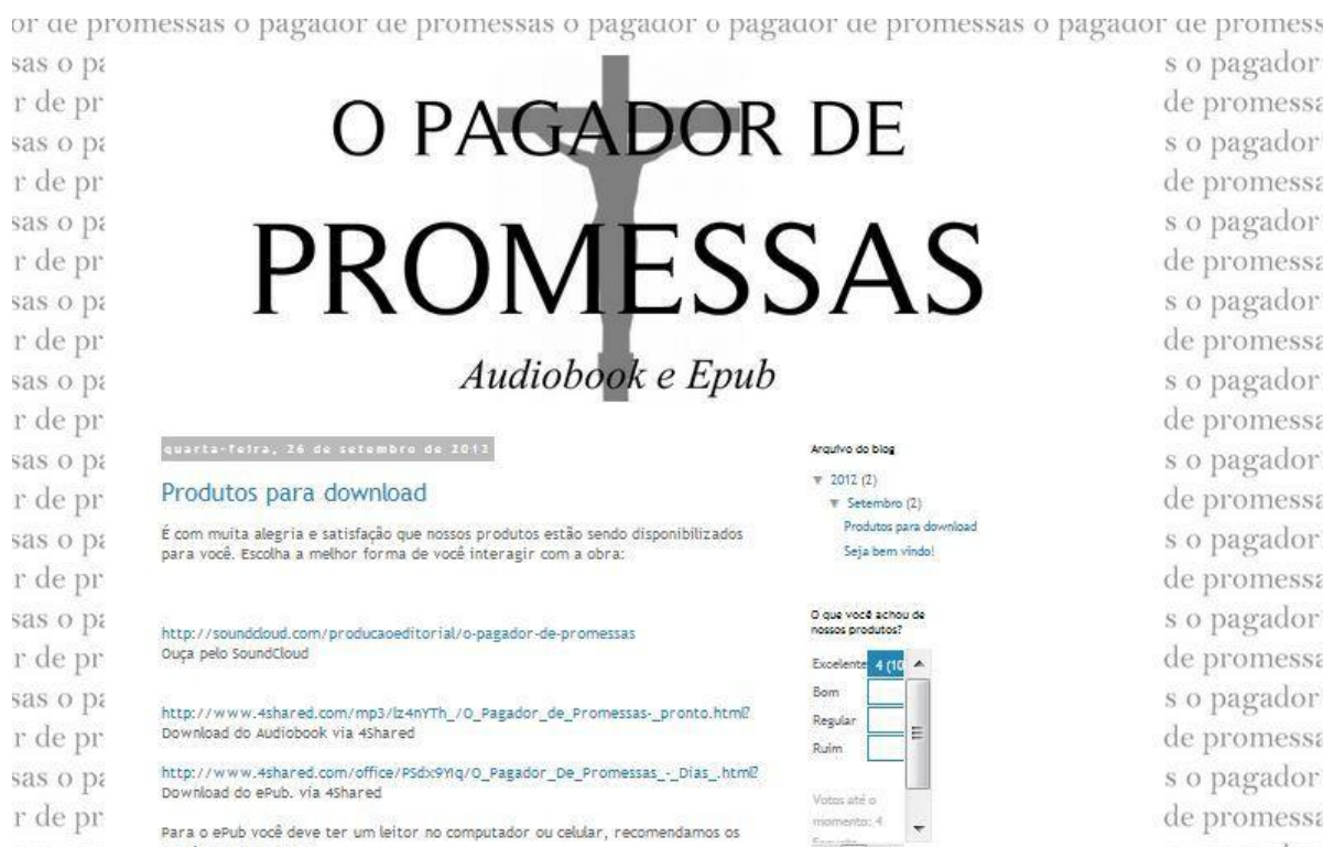
Figura 2 - Blog o pagador de promessas, desenvolvido no projeto.

dispositivos PC, tablet e celular, também possibilitando a interação através de comentários e enquetes.