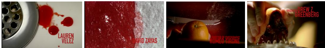
Figura 1: Cenas da vinheta de abertura (impressão de tela Dexter 1ª temporada)

Logo no primeiro episódio, nas cenas iniciais, a fisionomia intelectual do personagem começa a ser construída na primeira de várias sequências da série em que há uso do recurso do flashback . Nesta sequência, Dexter está em seu barco e se apresenta: “Meu nome é Dexter, Dexter Morgan. Não sei o que me fez ser como eu sou, mas o que quer que tenha sido deixou um vazio aqui dentro. As pessoas fingem muitas das interações humanas, mas eu sinto que finjo todas e as finjo muito bem”. Apesar do conteúdo dramático no que o personagem diz, o tom de sua fala é sarcástico.