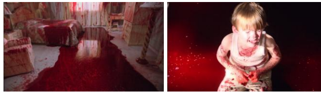
Figura 7: A descoberta sobre o passado, Dexter criança em meio ao sangue (impressão de tela Dexter 1ª temporada)

A partir do décimo episódio, Dexter passa a imaginar um menino chorando, banhado em sangue. Esta memória surge graças a uma cena de crime proporcionada pelo ITK , que colocou em um quarto de hotel o sangue de todas as suas vítimas. Neste momento, Dexter tem a lembrança de que esta criança é ele mesmo. Novamente nestas cenas, é possível notar o apelo estético traduzindo a relação do personagem principal com o sangue, como se seu dark passenger tivesse nascido naquele momento.