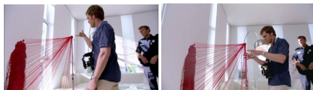
Figura 3: Ainda sobre o apelo visual e questão estética. (impressão de tela Dexter 1ª temporada)

Esta característica é vista também no modo como o personagem trabalha para solucionar crimes: posicionando fios que se direcionam até os respingos de sangue, permitindo que ele descubra quais foram as ações dos criminosos e o percurso das vítimas. Dexter parece ser um assassino artista, totalmente ligado à estética e a perfeição tanto em seu trabalho forense quanto em seus próprios assassinatos.