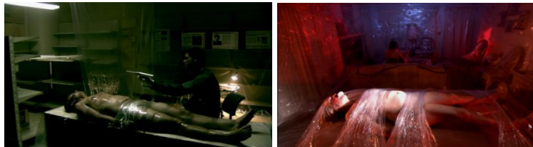
Figura 4: Uso de cores frias e quentes marcando o apelo estético da construção dos ambientes dos assassinatos. (impressão de tela Dexter 1ª temporada)

Dexter, como mencionado anteriormente, possui um apreço pela estética e perfeição, portanto pode ser considerado um “assassino artista”. Esta característica pode ser exemplificada pelo ritual que ele cria toda a vez que irá cometer um assassinato: cobre todo o local com plástico, lençol de borracha, fita adesiva, descarta tudo com saco de lixo preto e ainda, se preciso, limpa o local com alvejante. Sem contar também seu cuidado com suas roupas: luvas, avental e botas de borracha; e em algumas vezes um protetor para o rosto. Esse apelo estético é construído, na linguagem audiovisual, pela direção de arte e pela direção de fotografia. O uso de cores fortes e contrastantes e também de cores frias permite uma experiência visual que compõe os cenários das ações e a identidade da série, como é possível verificar na figura 4: