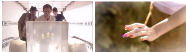
Figura 6: O recurso antecipatório: as unhas de Laura Mooser. (impressão de tela Dexter 1ª temporada)

O flashback e os recursos antecipatórios, que serão demonstrados a seguir, são estratégias de construção da narrativa relacionadas ao antagonista da primeira temporada. Tudo o que acontece tem ligação com a infância de Dexter e só faz sentido plenamente, tanto para o protagonista quanto para o espectador, no final da temporada.