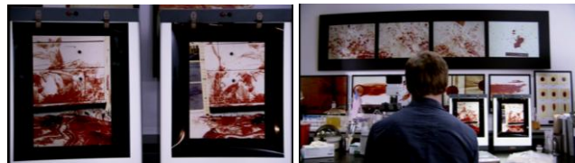
Figura 2: Apelo visual dos quadros com sangue. (impressão de tela Dexter 1ª temporada)

Esta característica é vista também no modo como o personagem trabalha para solucionar crimes: posicionando fios que se direcionam até os respingos de sangue, permitindo que ele descubra quais foram as ações dos criminosos e o percurso das vítimas. Dexter parece ser um assassino artista, totalmente ligado à estética e a perfeição tanto em seu trabalho forense quanto em seus próprios assassinatos.